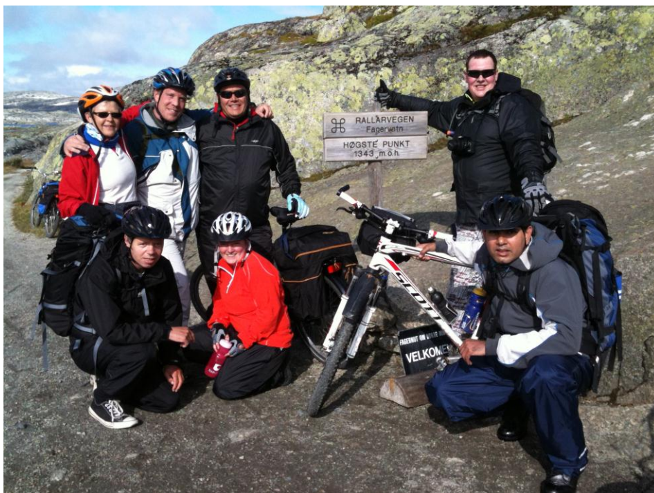
En glad og litt sliten sykkelgjeng på Rallarvegens og turens høyeste punkt; Fagervatn.

Året 2011 var jo i stor grad preget av at vi flyttet fra Lakkegata og opp til Hasle. Vi arrangerte derfor ikke et internkurs slik vi har gjort de foregående tre år. I stedet fikk alle som ville anledning til å delta på LAFY sin landskonferanse som ble arrangert i Oslo. Det var det mange som ønsket og de andre hjalp til med flyttingen.