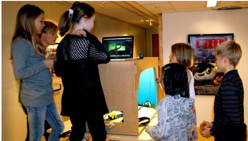
En av våre utmerkede animasjonsbokser i bruk hos NFI