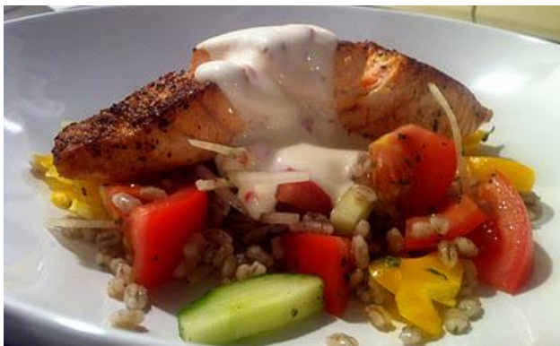
Stekt laks med byggrynsalat er en populær fredagslunsj