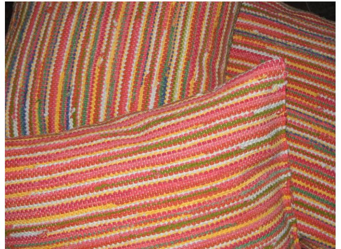
Puter sydd av filleryestoff

En arbeidstager har sluttet på tekstilavdelingen i 2011.